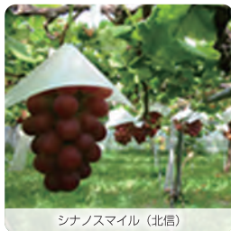
シナノスマイル (北信)