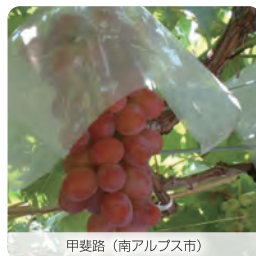
甲斐路 (南アルプス市)