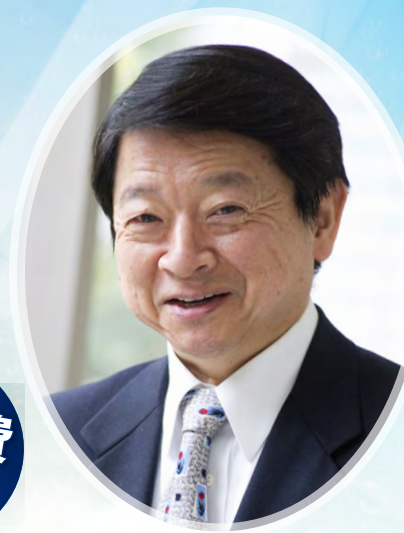
かたやま よしひろ 片山 善博 早稲田大学公共経営大学院教授

今、日本の民主主義は正常に機能しているでしょうか。主婦連合会創設者の奥むめおは「政治と台所の直結」を訴えて政治家となりました。女性議員をふやし、子育てや介護をしながら誰もが議員活動ができるようにするにはどうしたらいいでしょうか。くらしの声を地方や国の政治にいかん反映させることができるか、お話しいただきます。