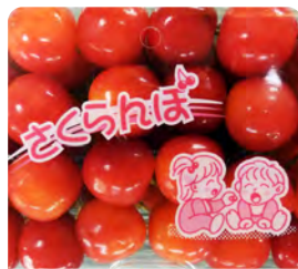
さくらんぼパック