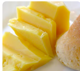
チーズ (ゴーダタイプ)